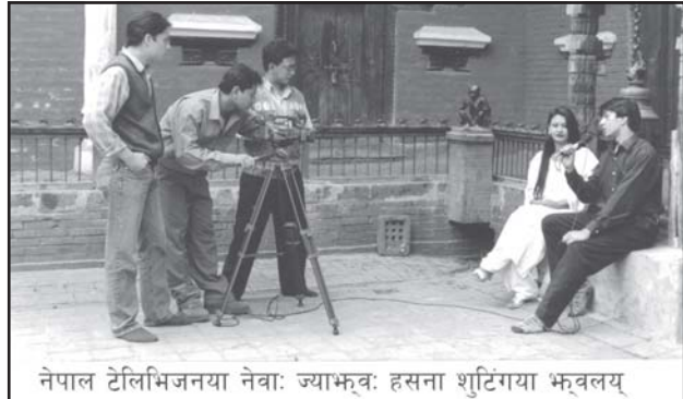
नेपाल टेलिभिजनया नेवाः ज्याभवः हसना शूटिंगया भूवलय

“नेपालमण्डल” या नाम न्ह्यानाच्वंगु थ्व च्यानलय् मुक्कं नेपालभाषाया ज्याभवः न्ह्यानाच्वंगु दु । नेपालमण्डल सिबें न्हापा कीर्तिपुरय् नं छगू च्यानलय् नेवाः भाय्या ज्याभवः न्ह्याये धुंकल । न्ह्यानाच्वंगु नं दनि । तर थ्व किपुलिइ दुनेजक हे सीमित जुयाच्वंगु दु । “हावलासा” निसें “नेपालमण्डल” तक्कया यात्राय् नेपालभाषाया टेलिभिजनय मेमेगु नं आपालं ज्याभवः वयेधुंकल । थुकियात कुलाः स्वयेवले नेपालभाषायात टेलिभिजनया लुखां व्यापकता व्यूगु ज्याभवः धइगु “हसना” खः । नेपाःया राष्ट्रिय